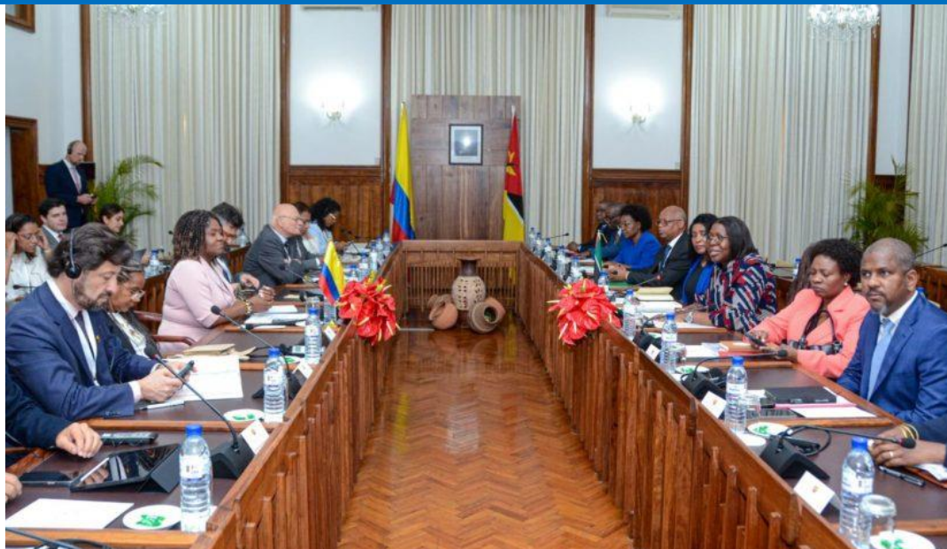
Reunión de trabajo de la delegación vicepresidencial con autoridades de Mozambique.